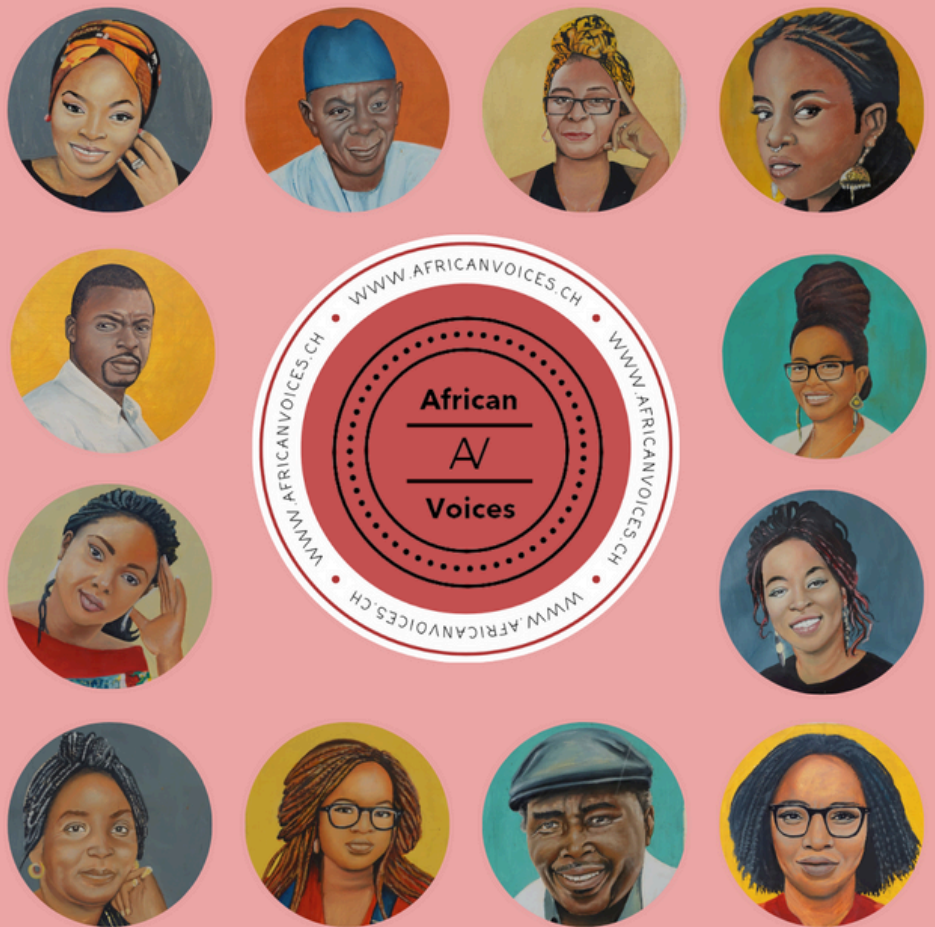
ABB.1: 16 AUTOR*INNEN UNSERER AFRO-LITERATUR-AUSSTELLUNG 2024

Afrika sichtbar machen! Afrikanische Literatur im Gespräch