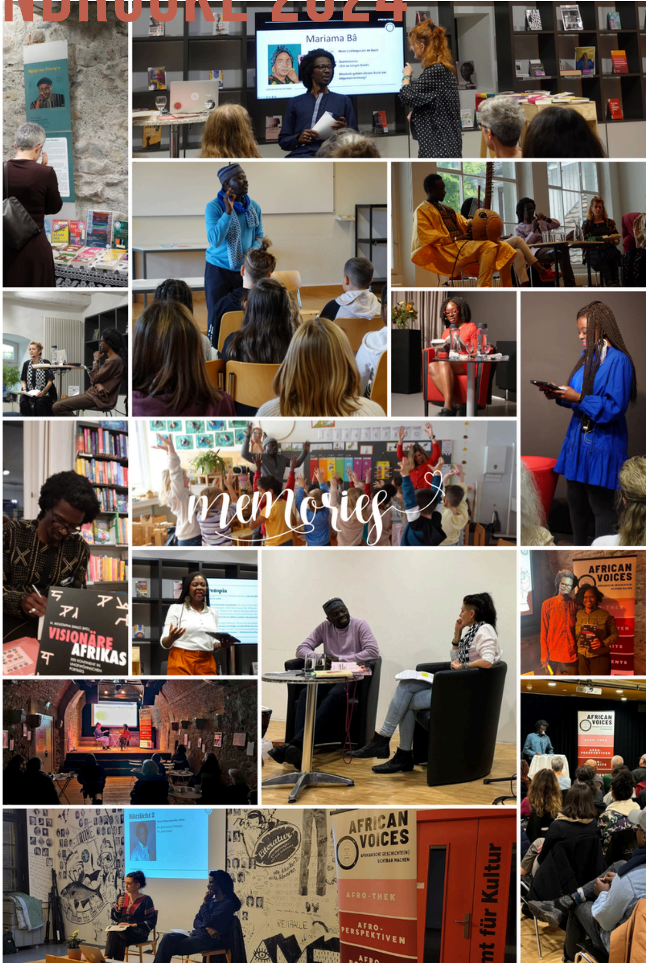
ABB.6: FOTOCOLLAGE 2024 AFRICAN VOICES